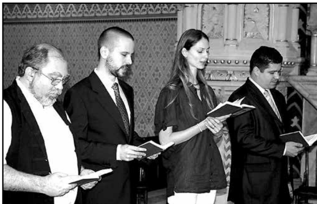
Felnőtt konfirmáció Szentháromság ünnepén

IFJÚSÁGUNK TÁBORA idén Orosházán volt július 11. és 14. között. Ezúttal térben és időben is a Szélrózsa országos evangélikus találkozóra való ráhangolódás volt a fő téma, amely július 14. és 18. között volt Szarvason „Középkedés veled” címmel. Ifjúságunk több tagja is komoly munkát végzett a szarvasi esemény lebonyolításában.