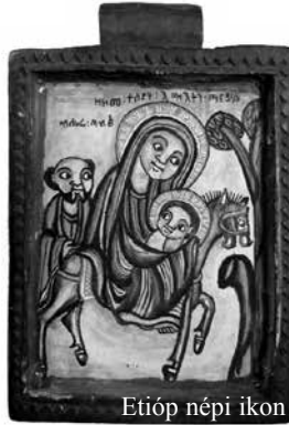
Etióp népi ikon

Isten terve azonban célba juttatja őket. Így olvassuk az evangéliumban Jézusról: Ott volt Heródes haláláig, hogy beteljesedjék az, amit az Úr mondott a próféta által: „Egyiptomból hívtam el fiamat.” (Mt 2,15) Ez a megmenekített fiú cseperedik fel, hogy megváltó, menekítő munkája mindent betöltsön és közel érkezen minden emberhez. Vajon otthonainkba megérkezett-e ez a menekült státuszú király? Visszatérésében egy új királyság, az erőszak gyakorlatával szakító hatalom és erő kerül bele a legkülönbözőbb emberi kapcsolatokba. A szeretet tiszta érintésével, a kicsinyek felé meghirdetett gyógyító, helyre állító munkával alapjaiban változik meg az emberi élet minősége.