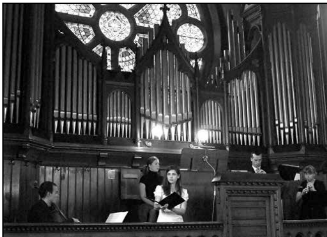
Koncert az árvízkárosultak megsegítésére