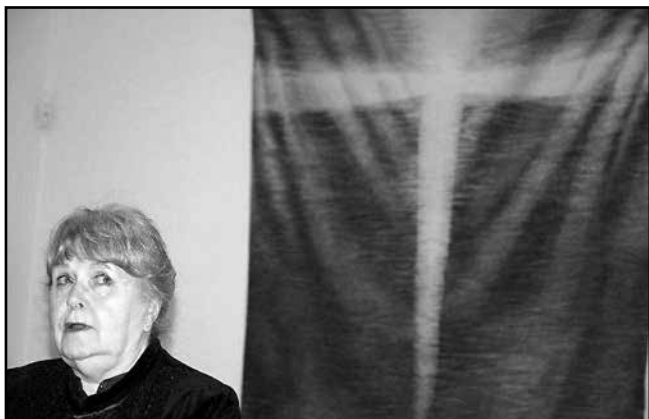
Ad fontes – Polgár Rózsa kiállításának megnyitóján, október 17-én

POLGÁR RÓZSA Kossuth- és Munkácsy-díjas kárpitművész kiállítása nyílt meg gyülekezeti termünkben október 17-én vasárnap délután. A számtalan külföldi és belföldi kiállításra meghívott művésznő ez alkalommal élete és