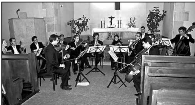
A Pesti Nyolc szeptember 25-ei programján játszik az Anima Musicae kamara zenekar

nézia nyugalmazott budapesti nagykövete saját fordítású Faludy-verseket szavalt indonéz nyelven. Az este közös vacsorával és beszélgetéssel zárult.