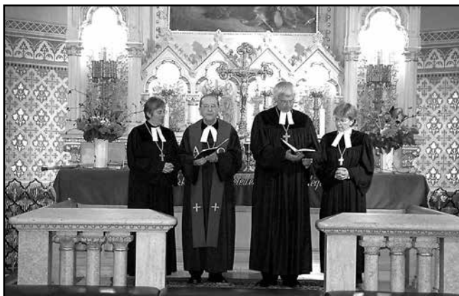
Istentisztelet a bajor–magyar testvéregyházi megállapodás ünnepélyes meghosszabbításakor, október 12-én