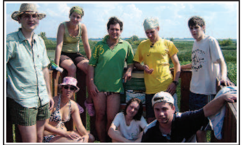
A felnőtt ifjúság a Tiszatónál, Poroszlónál evezett július utolsó napjaiban.