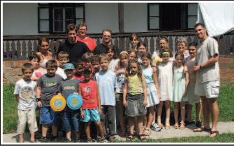
Csoportkép Keszőhidegkúton, a hittanos tábor résztvevőiről.