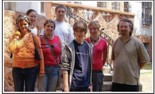
Nagyvelegi kisifis táborunk csoportképe a "kastélylépcsőn".