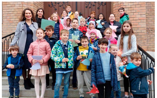
Teremtés ünnep a Fásorban (október 6.)