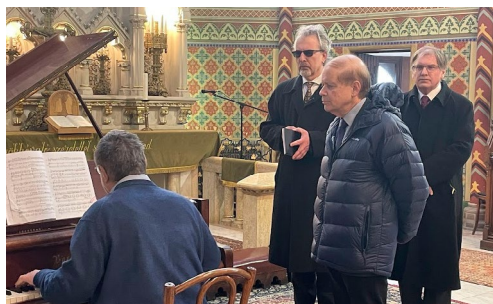
Izrael magyarországi nagykövete, Yacov Hadas-Handelsman is kíváncsi volt a mi szépséges templomunkra (február 7.)