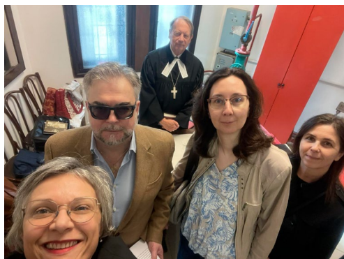
Szolgálatra készen. A vasárnap igéit nyár óta presbiterok és gyülekezeti tagok olvassák fel az istentiszteleten.