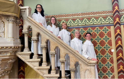
Felnőtt konfirmáció – vizsga és ünnepi istentisztelet (június 16.)