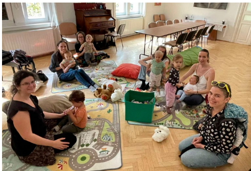
Baba-Mama körünk új tagokkal