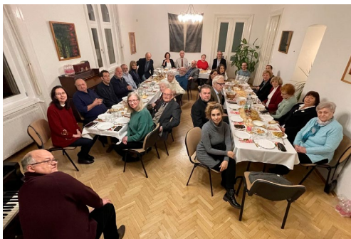
Adventi fehér asztalos presbiteri ülésünk (december 5.)