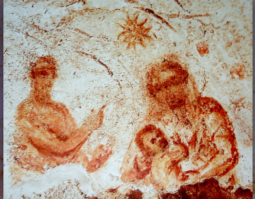
Kép: Madonna a gyermekkel (Kr. u. 230-240), Priscilla-katakomba, Róma

Örömteli adventet, áldott karácsonyt, és békés új esztendőt kívánunk!