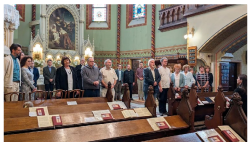
Tisztújítást követően az újonnan beiktatott presbíterek és tiszt- ségviselők (április 14.)