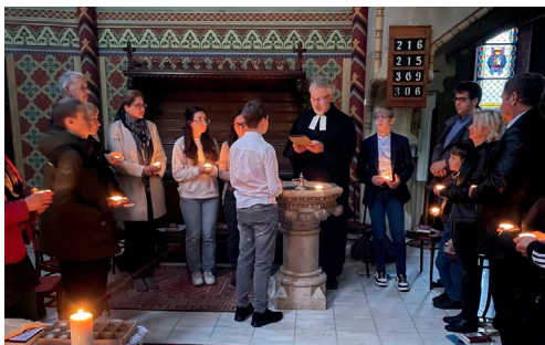
Húsvét hajnali istentisztelet keresztelővel (március 31.)