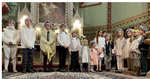
Gyermekek Karácsonya (december 17.)