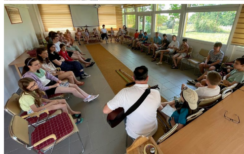
Csákvári hittanos tábor (június 23-29.)