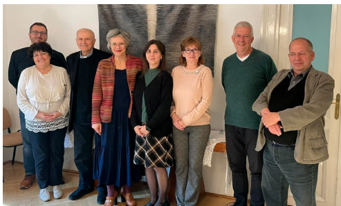
Ökumenikus lelkészimaóra a Faszorban (október 15.)