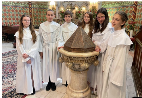
Pünkösdi konfirmáció (május 19.)