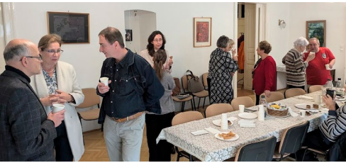
Minden hó 2. vasárnapján kávé és süti mellett beszélgetünk az istentisztelet után