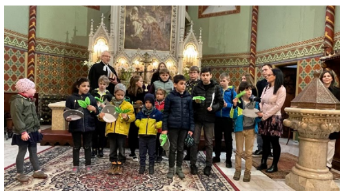
Virágvasárnap (március 24.)