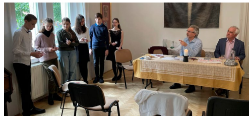
Konfirmációi vizsga (május 18.)