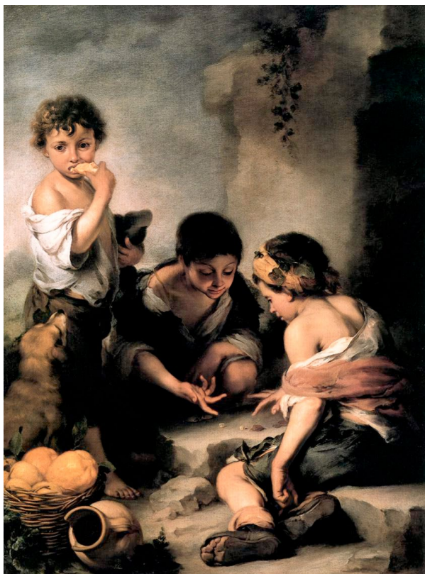
Bartolomé Esteban Murillo: Kockázó fiúk, 1675

Az év utolsó heteiben a karácsony varázsát, az elmúlás szorítását és az új esztendő távlatainak bizonytalansággal, aggodalmakkal és reményteli várakozásokkal vegyes izgalmát egyszerre éljük át. Lélekben talán a szokásosnál is nyitottabbak vagyunk. Isten ezért egészen különleges meghittséggel tárja fel előttünk a szívét. Ahogy az anyák szoktak gyermekeikhez, szemük fényeire szólni, úgy hajol hozzánk megnyugtató,