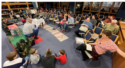
Szárszói gyülekezeti hétvége (december 8-10.)