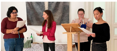
Az idei négy amerikai önkéntes szolgálata az ünnepi kiküldő istentiszteleten (szeptember 17.)