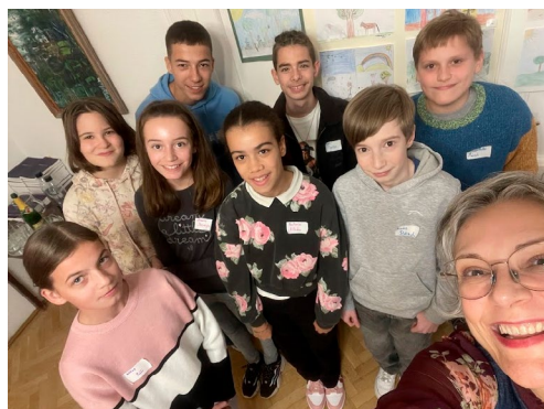
Jelenlegi konfirmandusaink (október 20.)