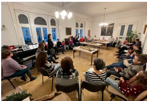
Adventi kézműveskedés (december 2.)