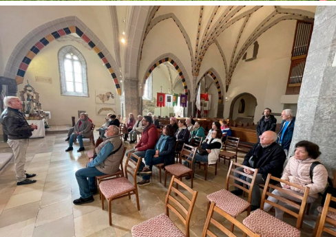
Őszi gyülekezeti kirándulás (október 19. Gyöngyöspata, Gyöngyös, Tarnaszentmária, Feldebrő, Hatvan)